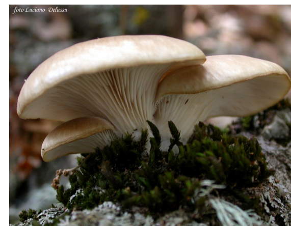
Pleurotus Ostreatus (commestibile ottimo)